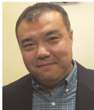
上智大学教授 立憲デモクラシーの会呼びかけ人